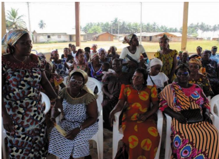
Ilustración 1: Mujeres pescadoras de Grand Béréby, Costa de Marfil.